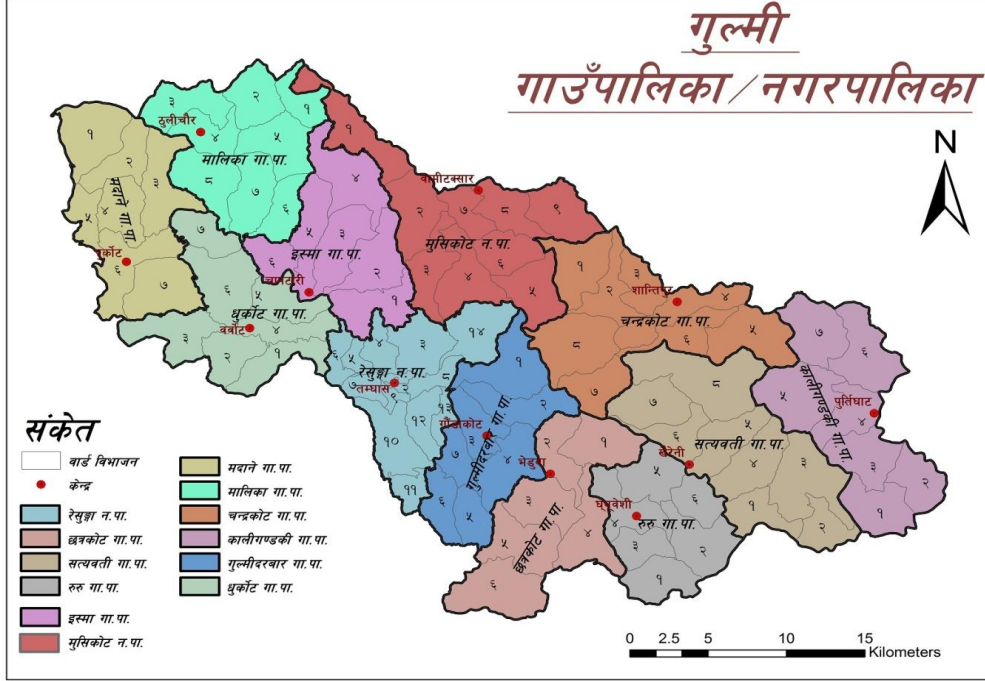
चित्र नं १: गुल्मी जिल्लाको नक्सा

नेपाल राज्यको इतिहासमा महत्वपूर्ण भूमिका राखे लुम्बिनी प्रदेश अन्तर्गत अवस्थित गुल्मी जिल्ला लुम्बिनी अञ्चलको उत्तरी सिमानामा पर्ने मध्य पहाडी जिल्ला हो। सैनिक छाउनी वा पल्टन भएको ठाउँलाई गुल्म भनिने शब्दबाट यस जिल्लाको नामाकरण भएको मानिन्छ। लिच्छवीकाल र मध्यकालमा सामरिक महत्वका हिसाबले सैनिक छाउनी रहेको गण्डकी नदी छेउको छाउनी भएकोले गढिगुल्म भन्ने गरिएको र चारपाला भनिने ठाउँलाई गुल्मीकोट भनिने आधारमा यस जिल्लाको नामाकरण गुल्मी रहन गएको किम्-दन्ती रहेको छ।